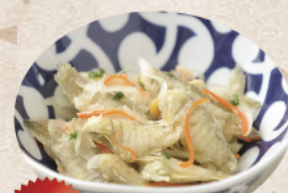
4位 ねぶとの南蛮漬け