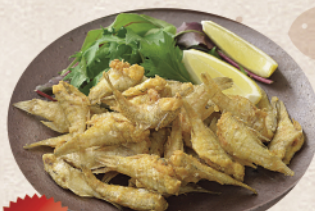
2位 ねぶとのから揚げ