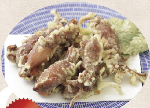
1位 ちいちいいかの天ぷら