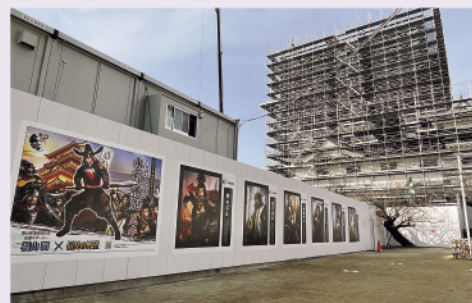
工事中の福山城の様子(1/15現在)

天守前広場東側(管理事務所前)の工事中仮囲いに「信長の野望」コラボデザインシートを設置しました。初代藩主水野勝成にゆかりの深い9人のキャラクターがデザインされています。令和の大普請で変わりゆく福山城とともに楽しんでみてください。