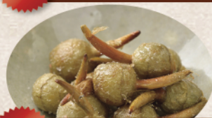
3位 くわいの素揚げ