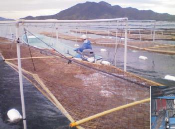
〔内海の のりの養殖と加工場〕