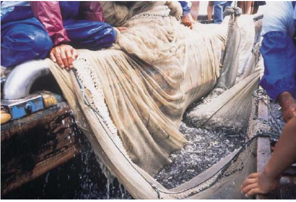
〔走島沖のカタクチイワシ漁〕