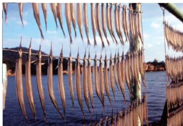
〔鞆の魚の干物作り〕