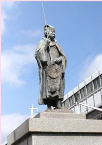
いづら ちようじんぞう 〔五浦釣人像〕

平櫛田中が尊敬する岡倉天心の姿を彫刻した像です。昭和50年に山陽新幹線の開通と福山駅舎の完成を記念して福山駅前に建てられました。