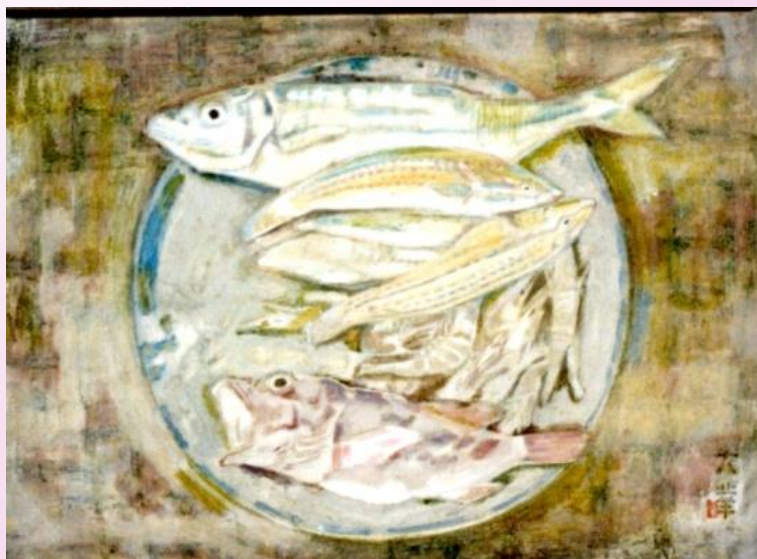
かいぎよせいぶつ 〔海魚静物〕

新鮮な魚介を味わいのある作風で描いています。大華は穏やかな画風の中にも深い趣のある色彩で知られています。 (菅茶山記念館所蔵)