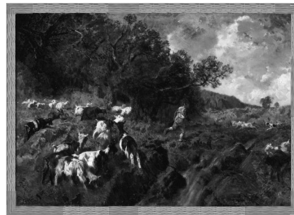
ジュゼッペ・パリアツィ 《羊飼いと羊の群れの風景》1870年頃 ふくやま美術館