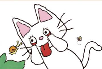
「あかんべノントン」 ©キヨノサチコ/偕成社