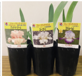
【ジャーマンアイリスポット苗2鉢】 引き換え場所:内海園芸 内海町11889 ☎986-2052

応募は市内在住の人で、はがきか電子版広報のどちらかで1人1回限りです。当選者の発表は引換券の発送(6月中旬ごろ)をもって代えます。当選者は引換券を持参して引き換え場所でプレゼントと交換してください。個人情報引換券の発送と広報「ふくやま」充実のためにのみ利用します。☎情報発信課☎928-1003 ID222075