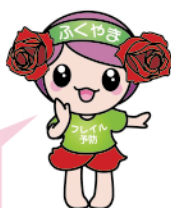
フレイル予防 イメージキャラクター 「フレイル予防ローラ」