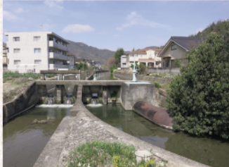
本庄村二股の分水