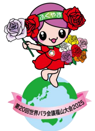
ばらのまち福山 イメージキャラクター「ローラ」

今後は2025年(令和7年)に開催される第20回世界バラ会議福山大会2025に向けて、世界に誇れる「ばらのまち福山」をめざし、ばらのまちづくりに取り組んでいきます。