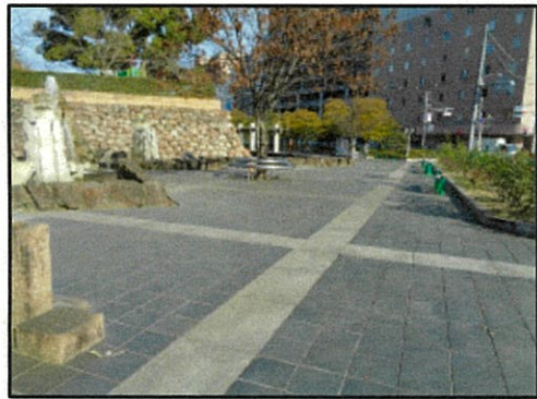
現況と同等のいぶしタイル舗装と切石舗装