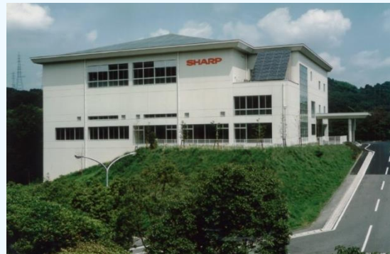
【シャープ福山スポーツセンター】