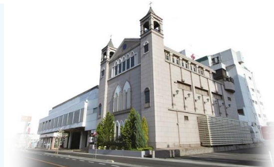
【福山労働会館みやび】