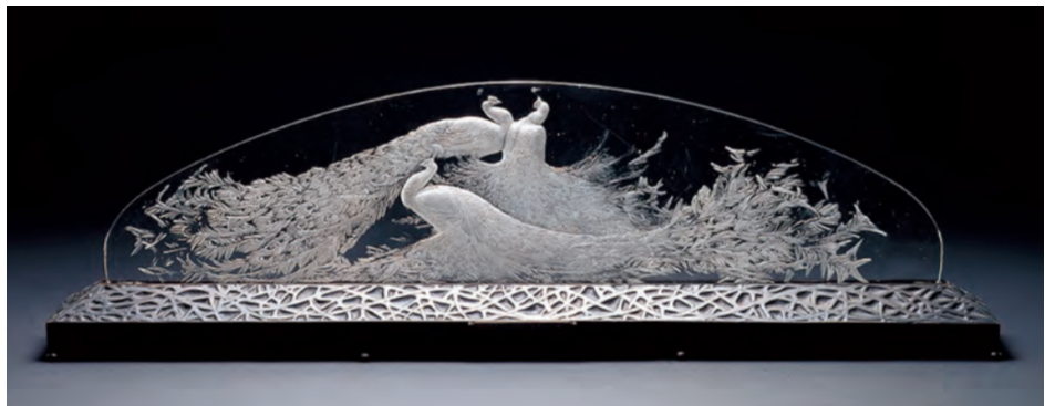
1. 立像《噴水の女神、メリト》1924年 2. (左から) 香水瓶《バラ》1914年 | 香水瓶《ユーカリ》1919年 | 扁平香水瓶《三組のペアダンサー》1912年 3. シール・ベルデュ蓋付花瓶《バラ》1921年 4. 花瓶《ナディカ》1930年 5. 香水瓶《シクラメン》1909年 6. カーマスコット《勝利の女神》1928年 7. テーブル・センターピース《三羽の孔雀》1920年 *すべて北澤美術館所蔵