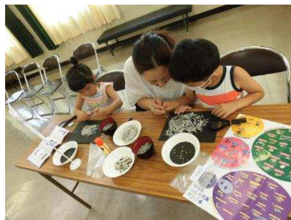
ちりめんモンスターをさがそう！