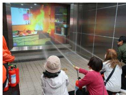
香川県防災センター現地研修