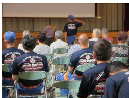
防災訓練(防災講演会)