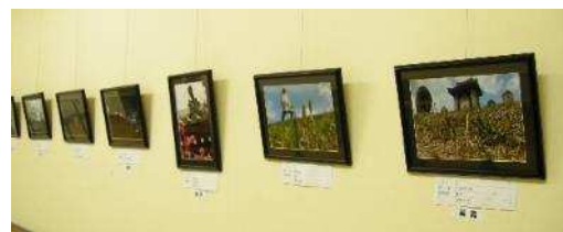
春の写真コンテスト