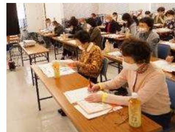
「認知症を知ろう」研修