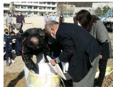
タイムカプセル埋蔵