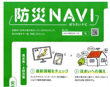
自主防災事業 (ポスター学区全戸配布)