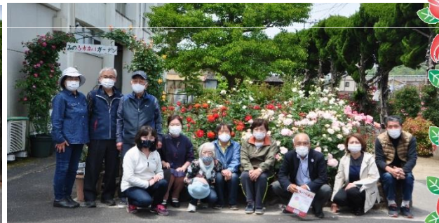
関係者のみなさん