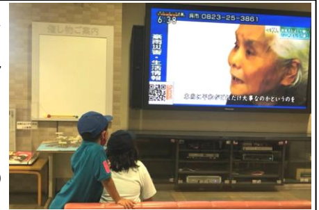
< 平和展の様子 >

7月31日(土曜日)から8月15日(日曜日)まで開催した平和アピール展では、13の保育所や保育施設の子どもたちが作成した作品を展示し、多くの来庁者にご覧いただきました。