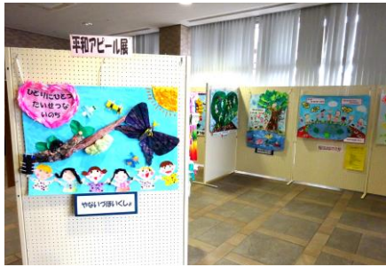
< 平和アピール展の様子 >

7月22日(木)から8月9日(月)まで、「夏休み子ども企画 平和展 『ヒロシマから平和への祈りを届けよう』」を開催しました。広島平和記念資料館から提供していただいたパネルや、NHK広島放送局及び福山市立大学の協力のもと被爆証言の上映などを行いました。また、会場に設置した笹竹には平和への願いが込められた短冊が多く結ばれ、平和の大切さを学び合うことができました。