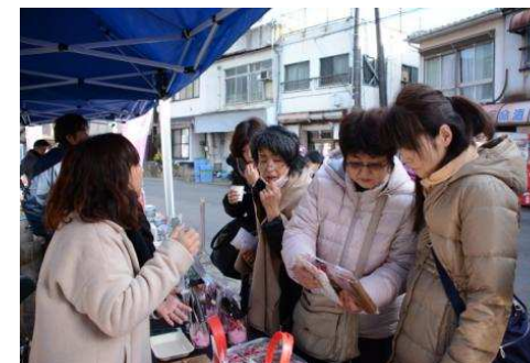
土産、物産テントの出店