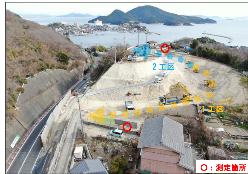
11月・12月の騒音・振動測定結果

引き続き、騒音・振動測定を継続するとともに、土埃対策としての路面への散水、ダンプトラックの安全運転の周知徹底等、周辺環境への配慮を行いながら、安全な工事に努めます。