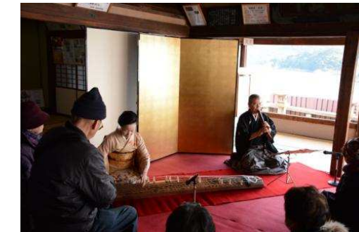
対潮楼での琴演奏