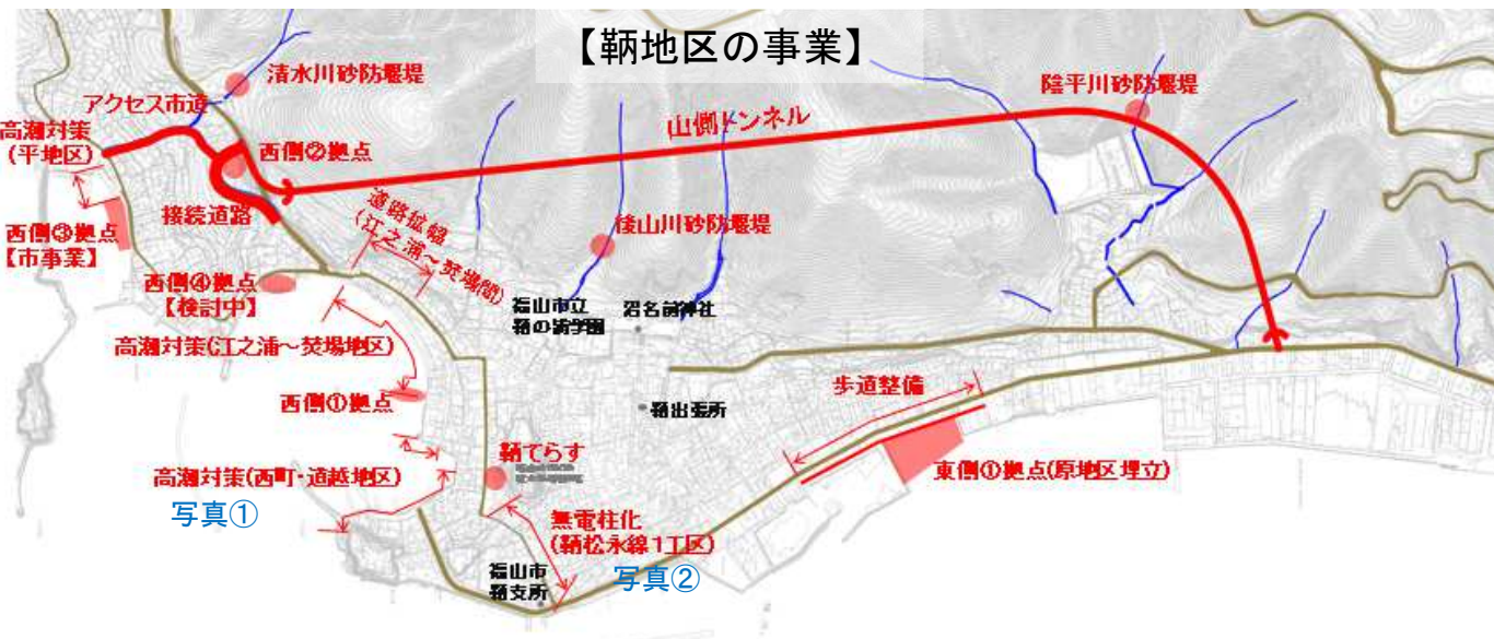
写真①：高潮対策（西町・道越地区）

明けましておめでとうございます。本年も宜しくお願いします。 旧年中は、平地区での接続道路の工事、西町道越地区の高潮対策工事、無電柱化区間（鞆永線1工区）での照明・舗装工事など、皆様には、多大なご理解とご協力いただき、ありがとうございました。 今年はいよいよ山側トンネルの工事に着手いたします。また、防災対策である高潮対策や砂防事業・交通交流拠点の整備についても進めていく予定です。 皆様には、引き続きご迷惑をお掛けしますが、ご理解とご協力をお願いします。