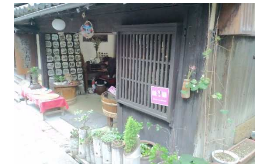
鞆町内商店の歓迎協力