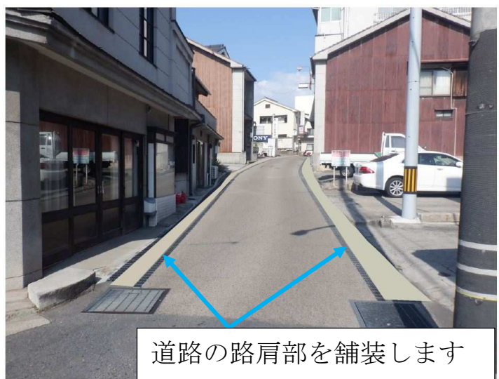
道路の路肩部を舗装します