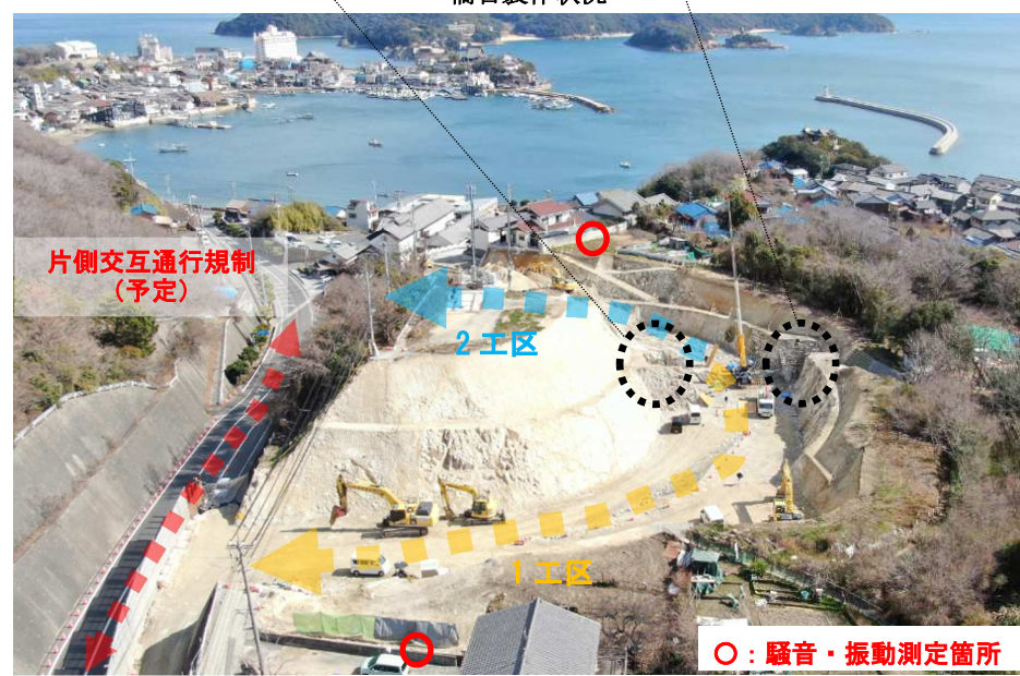
1月の騒音・振動測定結果(抜粋)