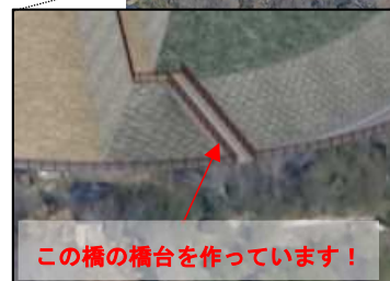
この橋の橋台を作っています！