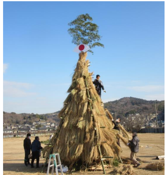
とんどを組立てる役員

前日から役員で藁などの材料を準備し、当日総勢30人で組立開始、2基のとんどが完成しました。15時15分点火、火入れされると炎が燃え上がり骨組みの竹がはじける音が響きわたりました。参加した約100名の町民は無病息災などを祈りました。