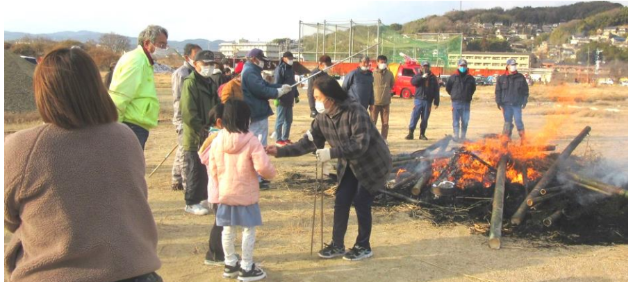
持ち寄った餅を美味しく頂きました。