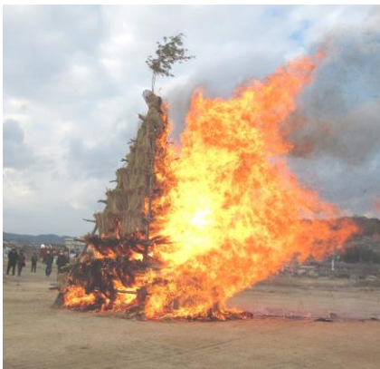
炎を上げて燃え上がるとんど