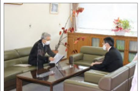
第3次経営審議会 答申 2022.1.24