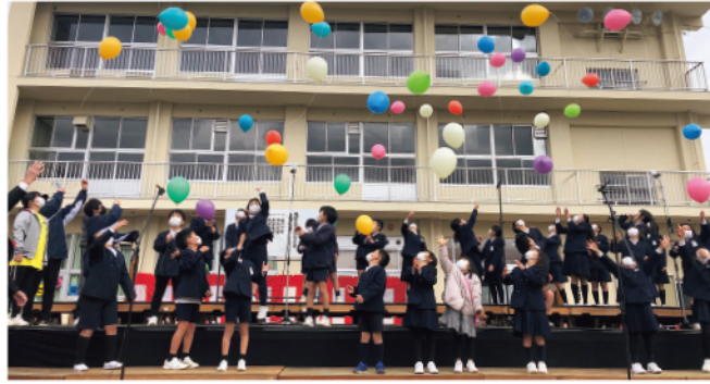
みんなの願いを込めた風船が舞い上がる落成記念行事

駅家北小学校への再編に伴い、閉校した服部小学校跡地に暮らしの拠点「服部交流館」がオープンしました。小学校の跡地の活用について、地域の皆さんに話を聞きました。