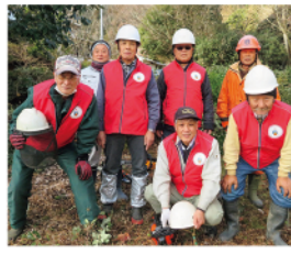
笑顔で出勤！ピッカリ会援隊

な利点だと思えます。会員も達成感を得ながら楽しんで活動しています。地域の高齢化が進む中、助け合いの気持ちやつながりを大事に、安心して暮らせるまちづくりをめざしています。 また会援隊を継続していくために、有償ボランティアで活動を行っています。今後は耕作放棄地の活用などの課題についても検討していきたいです。