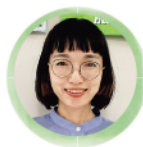
服部交流館 大元主事