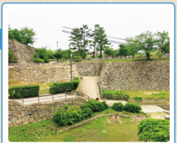
右が東坂三階櫓石垣、左が鹿角菜櫓石垣、その間の坂路に東坂上り櫓門がありました

して使用されてきました。 これらの櫓は1873(明治6)年の廃城令以降に取り壊されました。その後、その周辺には東坂路の敷設や民家建築、畑の造成などが行われ、改変されました。 現在は発掘調査の成果に基づき、後世の盛土を可能な範囲で取り除き、往時の美しい石垣の姿に近づける整備を進めています。 ※( )内の名称は阿部家時代の絵図に描かれている名称 ID260708