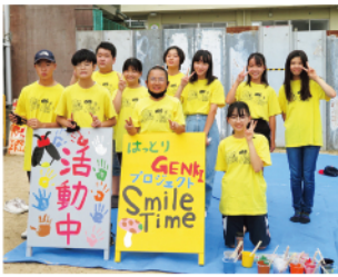
小学校5年生～中学校3年生で結成するSmile Time