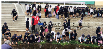
駅家北小学校3年生による放流風景

住民はハード整備だけではなく、ソフト事業にも力を注いでいます。地域目標とまちづくりテーマを実現するために「ほたるとの共生」や「地域の日常の暮らしを支える仕組みづくり」に取り組んでいます。