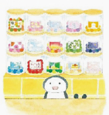
「ゆめぎんこう」(白泉社 2020年) ©aki kondo