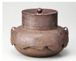
西村九兵衛(額口尾垂松梅地紋釜)