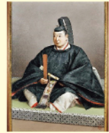
阿部正弘肖像画 (福山誠之館同窓会蔵)

福山藩阿部家7代藩主の正弘は18歳で家督を継ぎ、25歳の若さで老中に抜擢。その後老中筆頭となり、ペリーの浦賀来航や日米和親条約の締結に至る開国問題を老中首座として指揮。身分にとられない人材を登用し、文武一体の教育を進め、江戸と福山で藩校誠之館を開校しました。