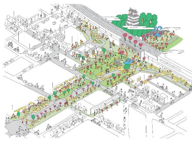
▲素案のイラスト（駅前広場と駅周辺）