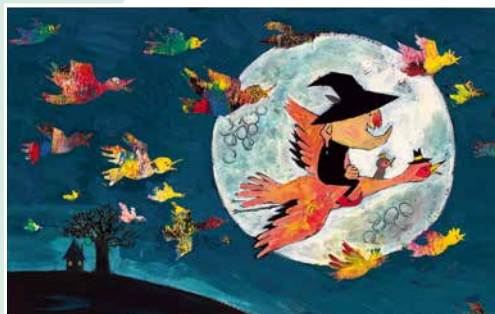
まじよのルマニオさん 2015年