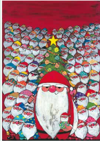
100にんのサンタクロース 2013年

*新型コロナウイルス感染症の拡大防止のため、本展の会期や内容に変更が生じる場合があります。最新情報は当館ホームページにてご確認ください。