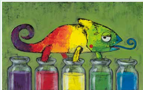
カメレオンのかきごおりや 2020年