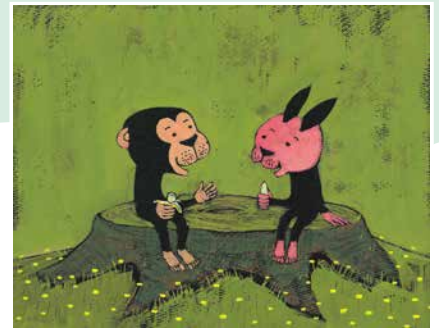
サルくんとバナナのゆうえんち 2014年