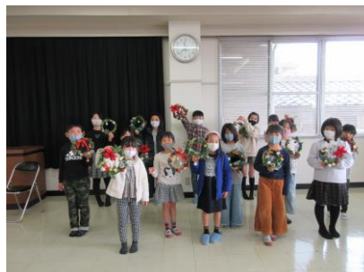
子どもチャレンジクラブ クリスマスリース作り