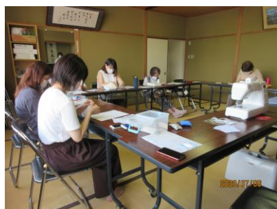
まちづくり生き生き講座 マスク作り