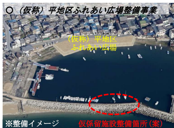
※整備イメージ 仮係留施設整備箇所(案)