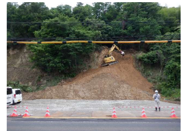
トンネルの東側出入口(坑口)の工事状況

当面は昼間(8:00～17:00頃)の施工となります。今後、トンネル内での作業に移行する際は、夜間の施工も実施しますので、時期が確定しましたら、この紙面でもお知らせします。