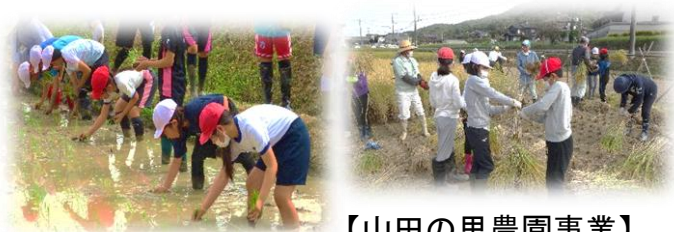
【山田の里農園事業】