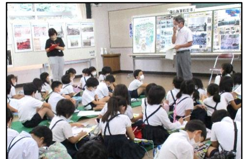
戦争の悲惨さを伝える写真展