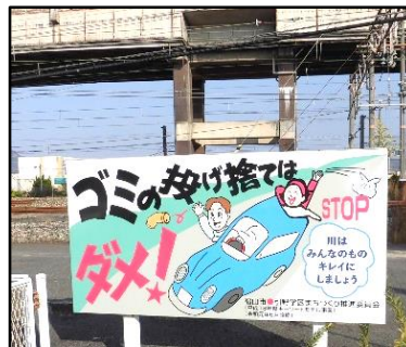
「ごみのポイ捨て禁止」看板