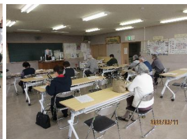
NHK大河ドラマの見どころ