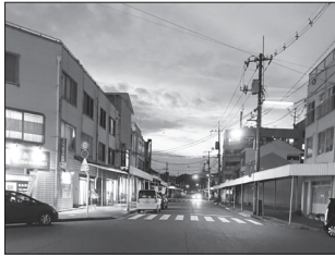
松永駅北口の様子

答 近年、店舗の閉店が続き、住宅や駐車場、学習塾などへの転用や、空き店舗が目立つ状態となっている。現在、地域住民と行政、隣の大学などが連携し、このエリアの在り方を検討しているところである。今後、まずは地域の魅力の評価を改めて行いながら、エリアのめざす将来像を共有することが必要と認識している。これは福山駅周辺のにぎわい創出をめざすに当たって採用したアプローチでもある。