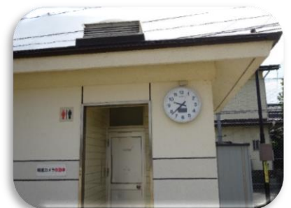
近田東公園へ時計の設置