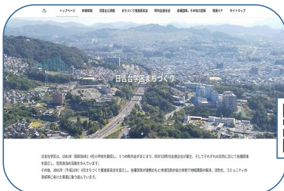
日吉台学区まちづくりホームページ

地域まちづくり事業が始まってすぐに取り組んだホームページは、運営に苦慮していったん中止していましたが、ここ数年、総務部会を中心に検討し、編集委員会を立ち上げ再度ホームページ開設にチャレンジ。いろいろな方の協力をいただき、3月から運営開始しています。