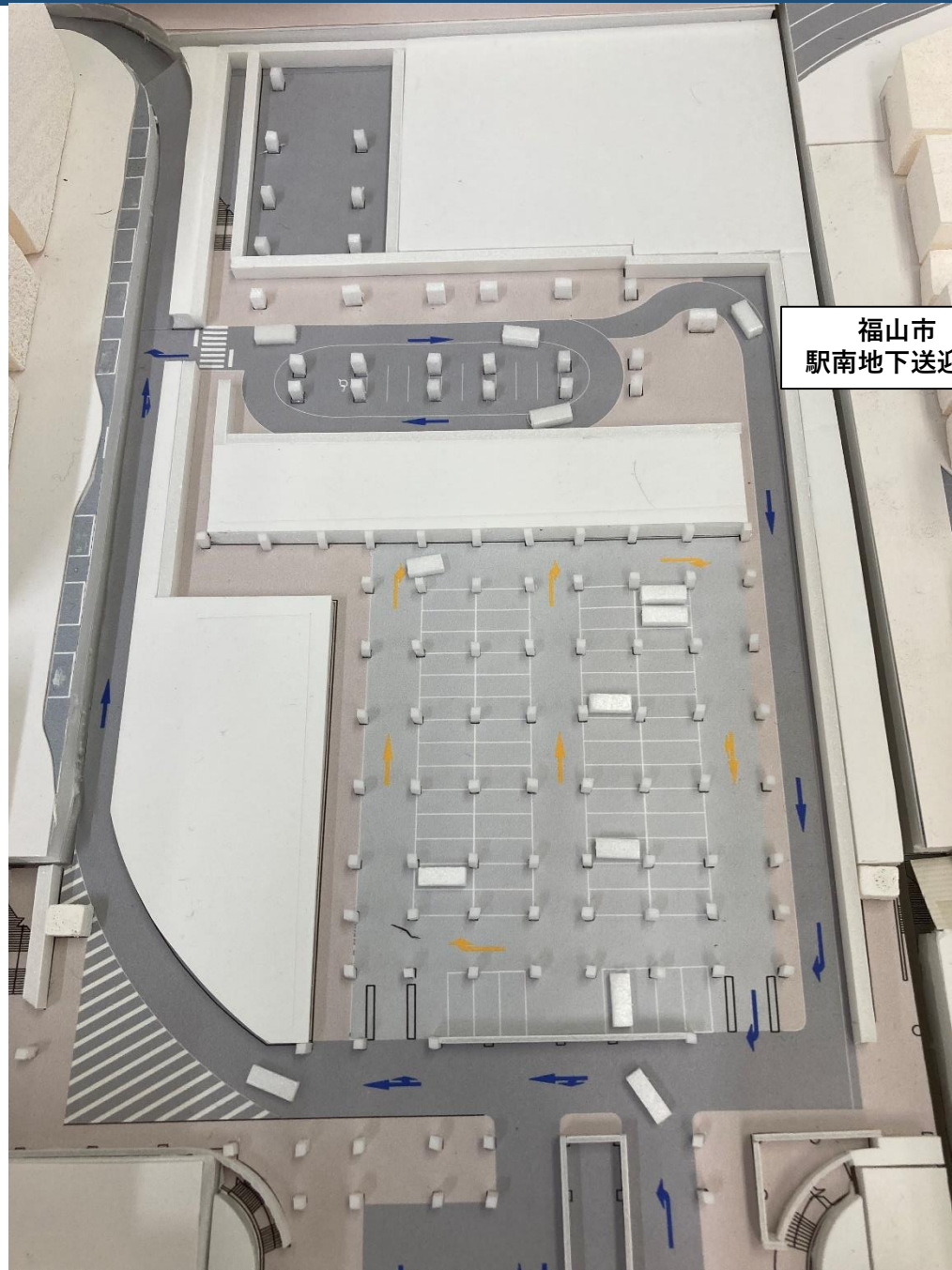
福山市 駅南地下送迎場