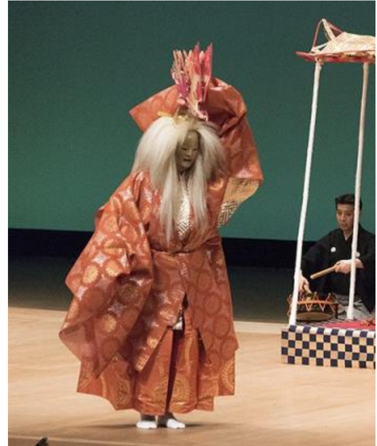
オープニングアトラクション 新作能「福山」 喜多流大島能楽堂