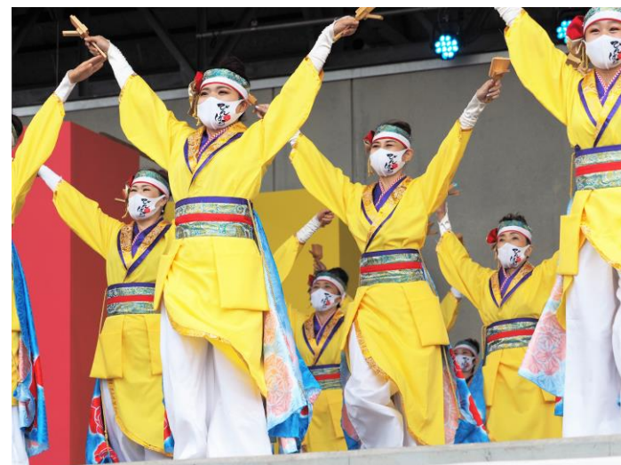
備後ばらバラよさこい踊り隊