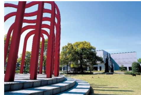
ふくやま美術館・書道美術館