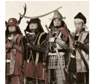
歴史好き芸人ユニット「ロクモンジャー」