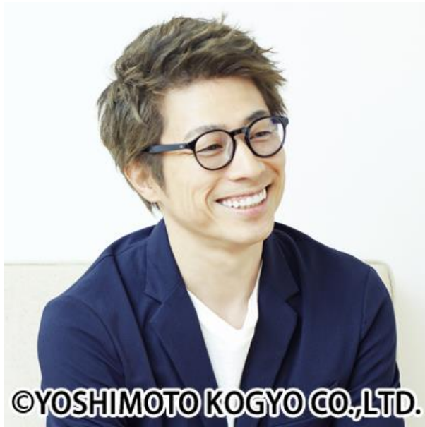
ロンドンブーツ1号2号 田村 淳さん