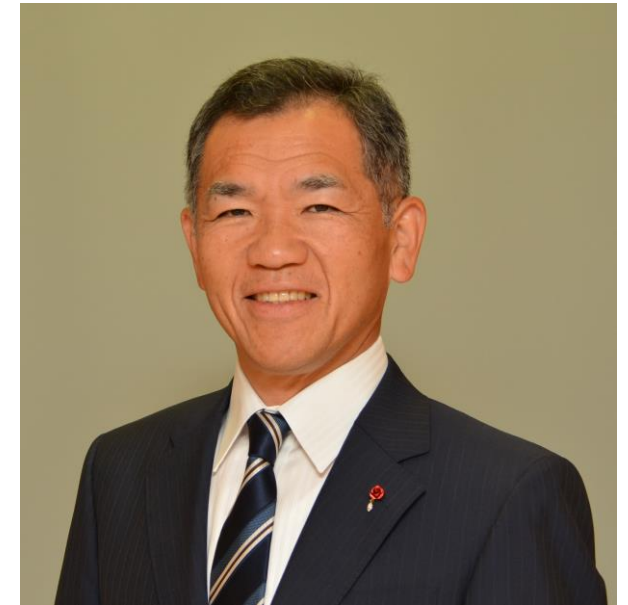
福山市長 枝広 直幹