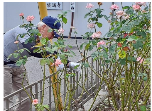
『いこいの広場の整備』