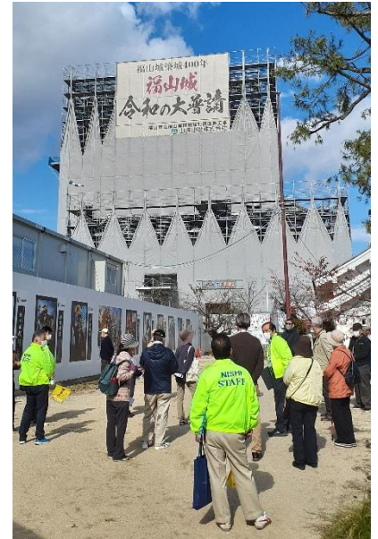
第43回 西学区ハイキング