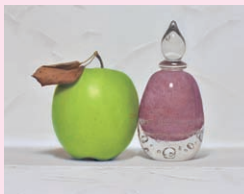
講師作品 上西竜二《Queen》