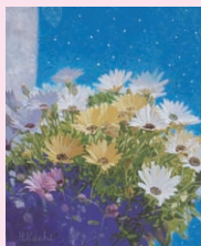
講師作品 高地秀明《花の詩II》