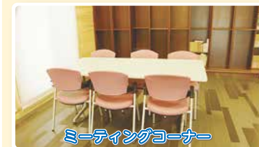
ミーティングコーナー

地域の皆さんが、事前予約なしに、気軽に立ち寄り、談話や打合せに利用できるふれあいと憩いのフリー空間です。キッズコーナーでは、親子で遊べます。