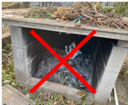
家庭ごみ（紙ごみ）等の焼却