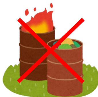
ドラム缶での焼却