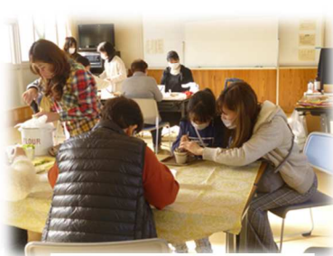
多肉植物の寄せ植え

12月6日(火)から16日(金)今津交流館において『昔の街並み、旧小学校』などの写真展を開催しました。昔の写真を見ながら思い出話に花を咲かせていました。