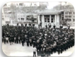
旧今津小学校朝礼の様子

また、10日(土)、11日(日)は、みんなが楽しめるワークショップを開催し、400人以上の方の参加をいただき、楽しい文化祭となりました。