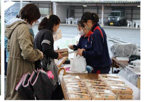
ポツの工夫がすごい! たくさん売れました!