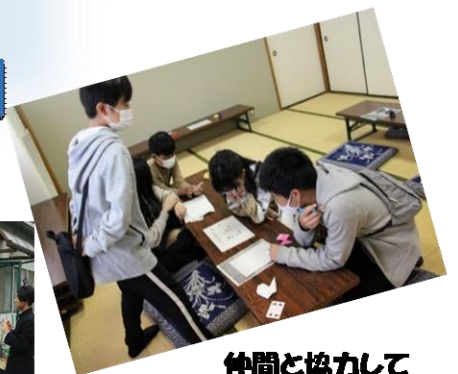
仲間と協力して 謎を解いて脱出だ！