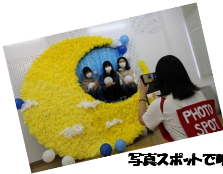
写真スポットで映え！ こだわりのパネルが すごいです

11月13日(日)沼隈支所・沼隈サンパルにおいて、人・まち・ふくしまマルシェ実行委員会が「人・まち・ふくしまマルシェ2022」を3年ぶりに開催しました。小雨が降るなかのスタートにもかかわらず、約3,000人が来場されました。今回は地域の関係団体に加えて、今年創立した想青学園9年生が「想青祭」と題し「地域って最高」というテーマで企画段階から生徒が主体となり、多くの人に来場してもらい、楽しんでもらえるよう、意見を出し合って準備をしてきました。パネル展、謎解き脱出ゲーム、おぼけやしき、スタンプラリー、写真スポット、想青SHOP、秋祭り、学校放送局など工夫いっぱい、元気いっぱいに会場を盛りあげてくれました。当日の様子を少し紹介します！