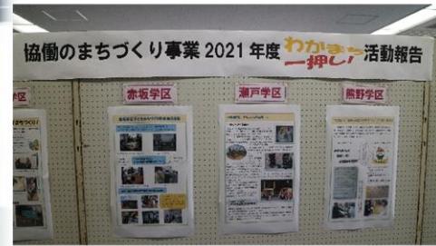
まちづくり・地域づくり活動の様子が わかりやすく紹介されていました