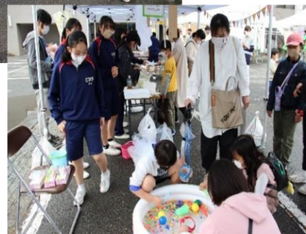
破れないように そっと上手に スーパーボールを すくってました！