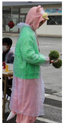
スタンプラリー 場所とキャラクター を見つけて出して スタンプをゲット！