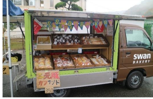
惣青SHOP パンとお弁当を販売しました