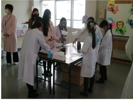
白衣を着て薬剤師体験 薬の分包にチャレンジ!