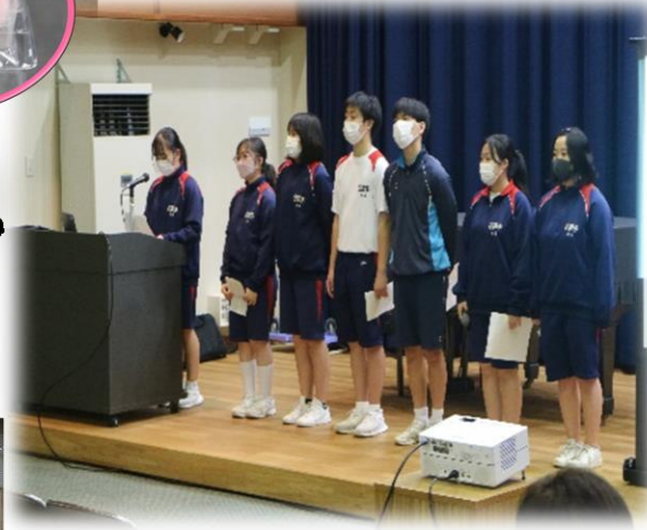
学校放送局 惣青学園の魅力をたくさんの人に発信!