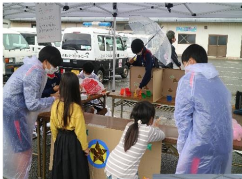
狙って狙って！的あて！ 真剣な表情で挑戦していました