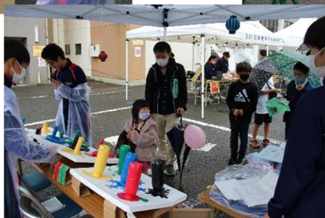
輪投げ！ 輪と同じ色のところを 狙って…それっ！