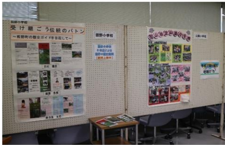
学校で取り組む地域の`わ` 学校の様子が紹介されていました