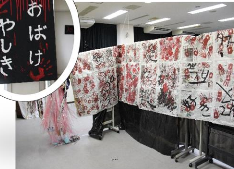
大人気で長蛇の列！ 悔いおぼけがたくさんいました