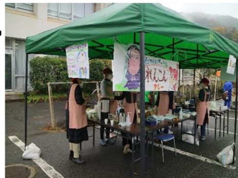
福祉関係SHOP カレー クッキー シフォンケーキ さをり織り 大盛況でした!