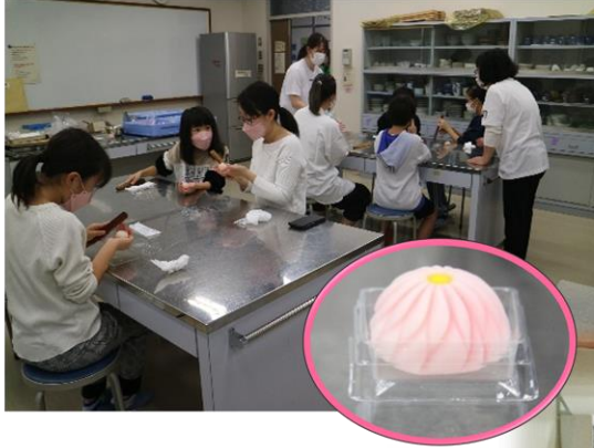
花びらの模様をつくるのが大変! 自分で作った和菓子は特別美味しいね