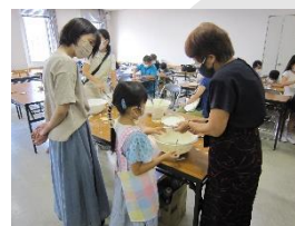
【びんごアート研究会】