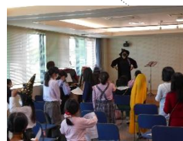
【海のみえる合唱教室】