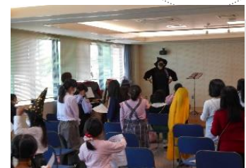
【海のみえる合唱教室】