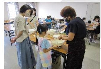
【びんごアート研究会】

【問合せ先】 福山市役所まちづくり推進部 人権・生涯学習課 TEL (084) 928-1243 FAX (084) 928-1229