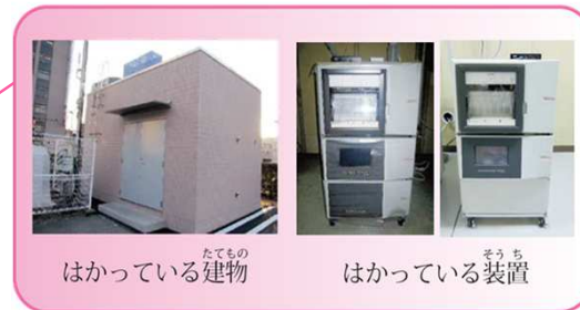
● はかっている場所