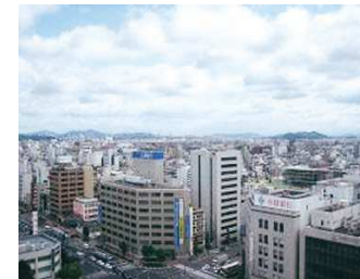
つうじょう そら 通常の空