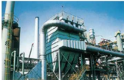
工場の排出ガスをきれいにする装置

また、自動車の排気ガスをへらすために電車やバスなどの公共の乗り物の利用を市民に呼びかけています。さらに、ハイブリッド車などの「環境にやさしい自動車」の使用をすすめています。