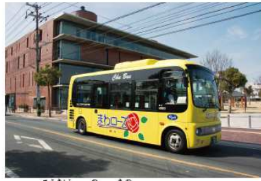
公共の乗り物「まわローズ」