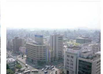
のうど たか ととき そら オキシダント濃度が高い時の空