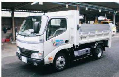
ハイブリッドディーゼルのダンプ車