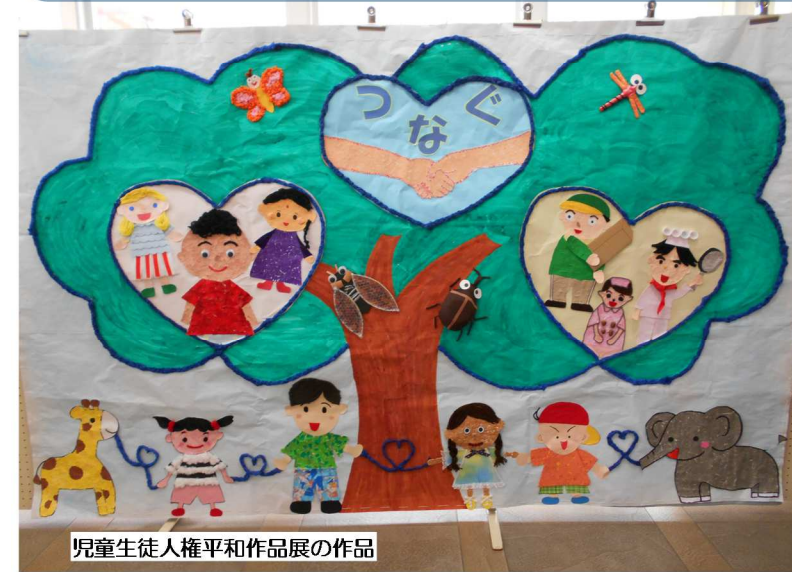
児童生徒人権平和作品展の作品

国際連合は、世界人権宣言が採択された12月10日を「世界人権デー」とし、記念行事を毎年行うよう決めました。世界人権宣言は、1948年12月10日に開催された第三回国際連合総会において採択され、今年で74年を迎えます。 この宣言は、人類に多大な惨禍をもたらした第二次世界大戦を痛烈に