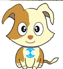
行施相談マスコット キクーン