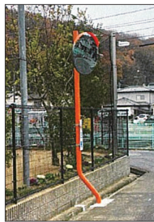
市内に設置されたカーブミラー

答 市内に約1万2千本あるカーブミラーは、年5回の市職員による道路パトロールで点検し、変状などを確認したのは713件、うち662件の改修が完了している。