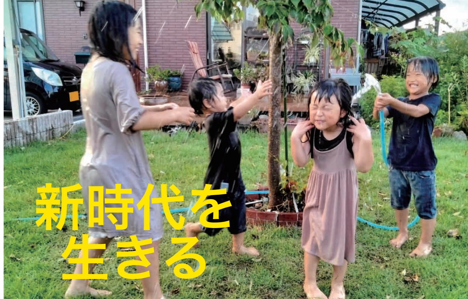
写真：2022 人権・平和フォト作品展 優秀賞「平和部門」

「児童の権利に関する条約（子どもの権利条約）」は、子どもの基本的人権を保障するために、1989年（平成元年）の国連総会で採択され、1990年（平成2年）に発効しました。日本は1994年（平成6年）に批准しましたが、私たちはこのことを暮らしの中にどれだけ活かすことができただけでしょうか。