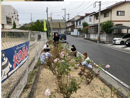
ばら花壇の手入れ