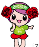
「フレイル予防ローラ」