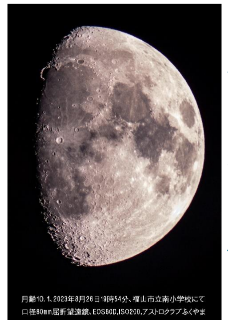
月輪10.1、2023年8月26日19時54分、福山市立南小学校にて口径80mm屈折望遠鏡、EOS60D、ISO200、フストクラブふくやま

天候が心配されましたが、やや曇り空の中、月のはっきり見えました。5台のなかなか見ることのできない立派な望遠鏡で、9組の親子が各々観測しました。20時20分頃、東の空に土星が現れ、参加者は楽しんで土星観測をすることができました。天体に非常に興味のある子もいたので、将来南学区から「天文学者」が生まれるかもしれませんね。ひと夏の貴重な体験ができた夜でした。