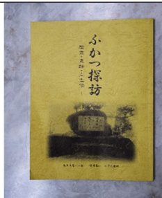
ふかつ読本の表紙