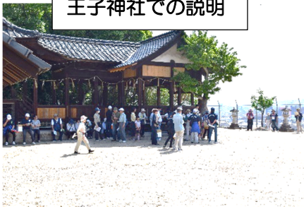
王子神社での説明