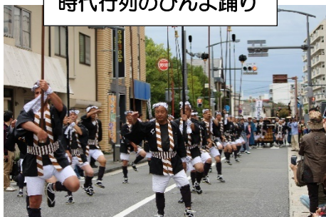
時代行列のひんよ踊り