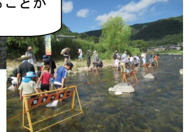
【図2：水辺教室開催時の様子】